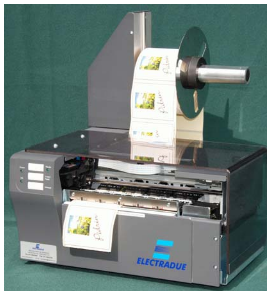
Versione potenziata con sbobinatore automatico per grandi bobine.

“LABELPRINT 900” è anche di facile installazione ed utilizzo. E’ possibile stampare testi, grafici, codici a barre in tutte le simbologie internazionali, immagini, contatori di bottiglie, lotto, annata, ecc. Può contare su un’ampia gamma di materiali su cui stampare: patinati, opachi, semi-patinati. Le dimensioni di stampa delle etichette coprono tutte le esigenze dell’enologia fino alle etichette per le bottiglie marasca per olio. Sono inoltre disponibili presso la nostra azienda nuovi formati e supporti cartacei come la carta vergatina ideale per etichettare vasetti, bottiglie di vino ecc. La stampante viene fornita di driver windows e può essere usata con il software grafico di nostra fornitura.