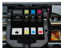
cartucce separate = riduzione dei costi di stampa