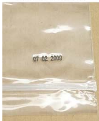
BUSTA IN PLASTICA

Stampante semiautomatica per la marcatura del lotto e scadenza su etichette o confezioni di prodotti alimentari